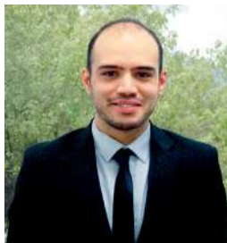
Samy SISAID, Sous-Préfet à la Relance auprès du Préfet de l'Isère

28 500 créations nettes d'emplois: cette accélération inédite dans l'histoire récente de l'Isère tient à l'engagement de l'ensemble des actrices et acteurs des projets publics et privés que nous avons collectivement déployés et accompagnés durant ces trois années, notamment avec l'aide de 2 milliards d'euros de France Relance.